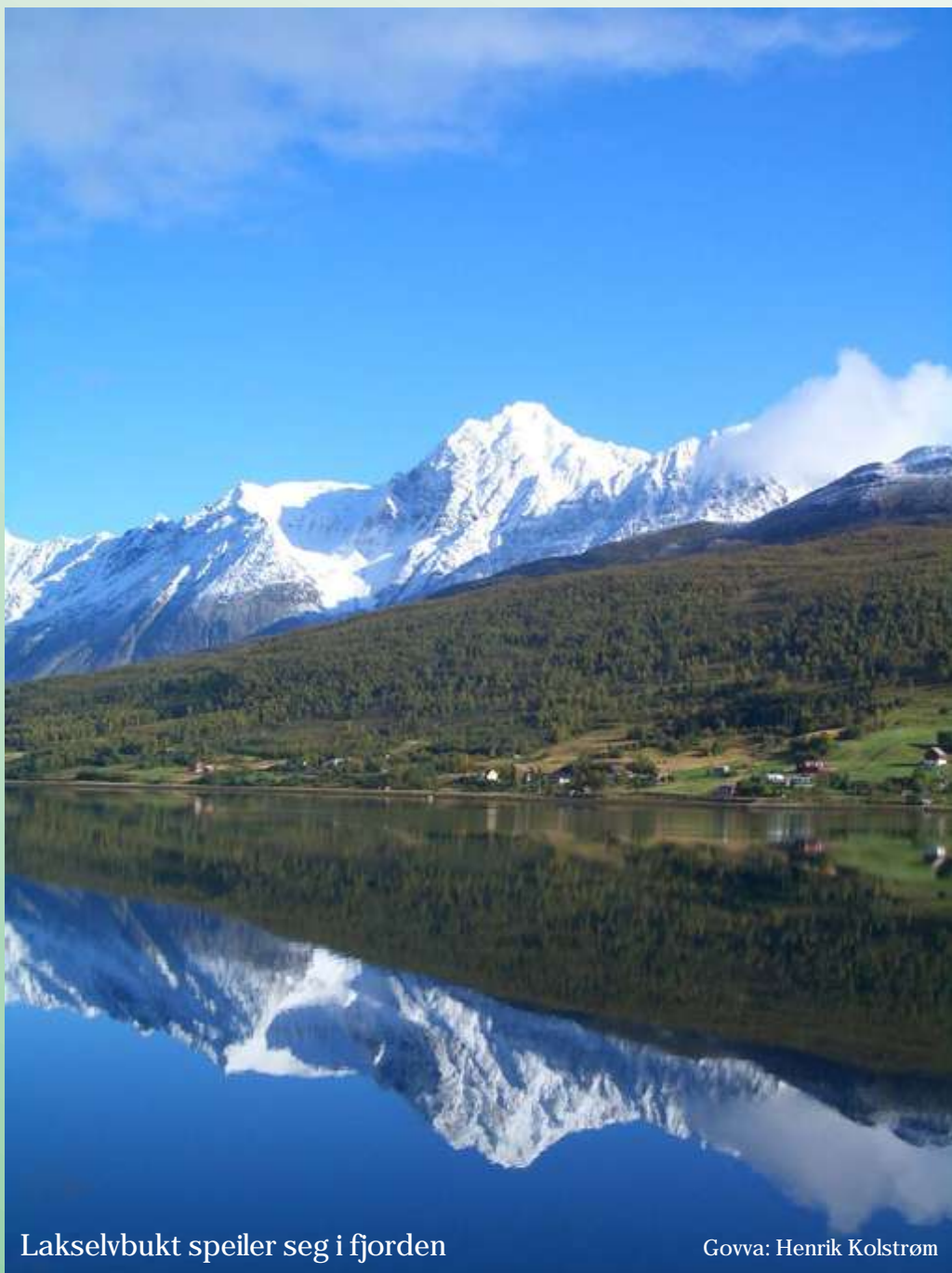
Lakselvbukt speiler seg i fjorden

SFF Samenes Folkeforbund - likeverd for alle -