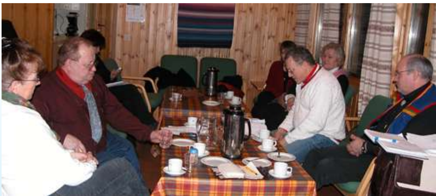
Fra årsmøte i Sirma