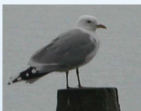
skávflie? = måse