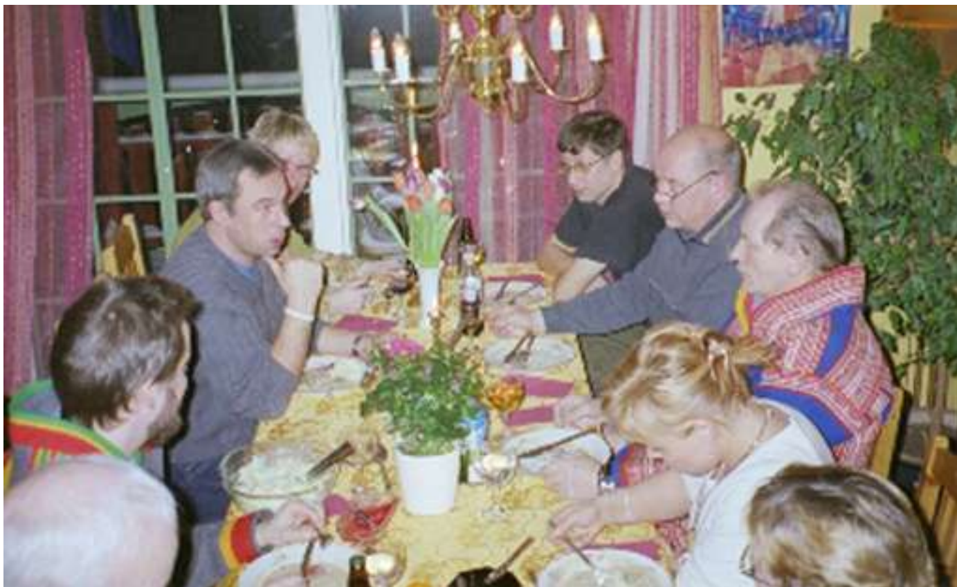
Ivrigte festdeltakere i Oslo og omegn SFF